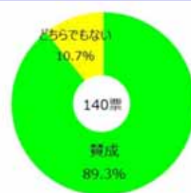
グローバルフェスタJAPAN 2016 アンケート集計結果